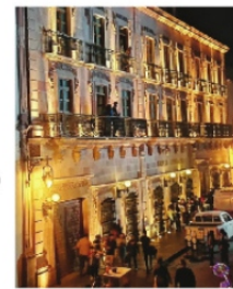
HOTEL EMPORIO, solo tuvo 2 habitaciones reservadas.

No es la primera vez que ocurre, pero tratos son tratos, fue una verdadera vergüenza que un artista de talla internacional como el señalado salsero puertorriqueño, haya tenido que usar ese audio tan de baja calidad y que además no se haya utilizado la consola que solicitó. Y ya que hablamos del Festival, quien si resintió la baja