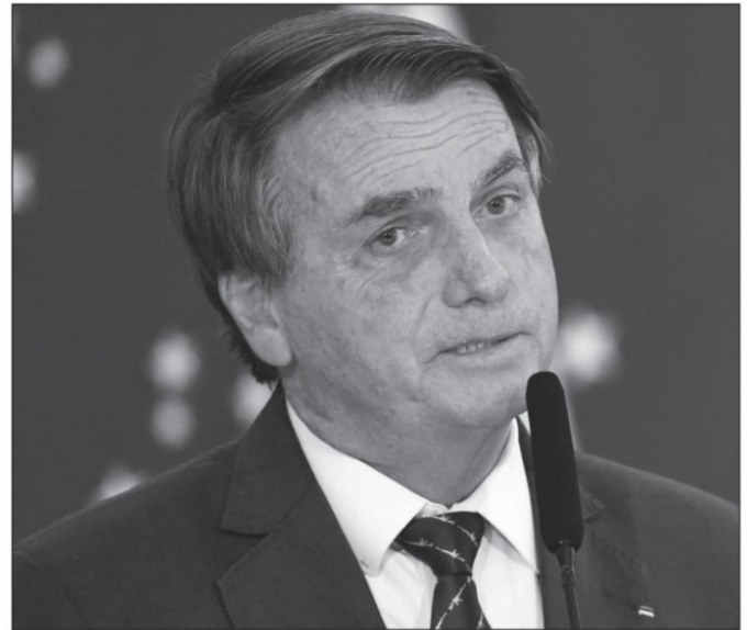
Jair Bolsonaro

Requerimos una pedagogía de la hospitalidad, ser auténticamente humanos. Nada más... ■