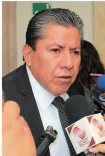
David Monreal Ávila