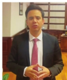
RODRIGO REYES MURGUEZA, Secretario General de Gobierno.

El Secretario General de Gobierno, Rodrigo Reyes Murgueza fijó la esperada postura del Gobierno en torno al caso de desafuero y destitución del alcalde de Guadalupe, dejó claro que el deseo es que todo se resuelva judicialmente bajo la premisa de "presunción de inocencia" y con respeto al debido proceso.