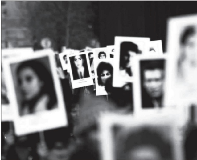
En México hay más de 111 mil personas desaparecidas, de las cuales, más de 5 mil son zacatecanas