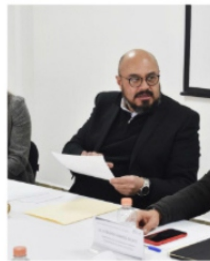
JULIO CESAR CHÁVEZ, se declara inocente.