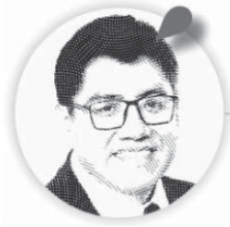
Saúl Monreal Ávila