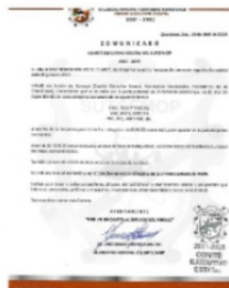
SUTSEMOP, logra aumento para sus agremiados.