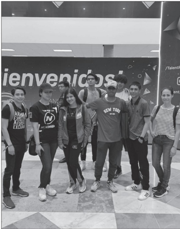
A principios de este mes se celebró el “Talent Land 2023”, evento dedicado al desarrollo de talento humano

Quien suceda al presidente López Obrador, además de contar con el más amplio respaldo ciudadano, debe haber demostrado, en los puestos públicos desempeñados, su coherencia con la 4T entre lo que piensa, dice y hace; llevar “tatuado” los principios “no robar, no mentir y no traicionar al pueblo”, sin medias tintas ni titubeos o coquetos con la oposición. ■