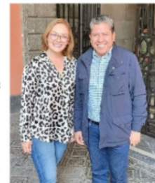
LA DELEGADA ACOMPAÑÓ A DM A PALACIO NACIONAL

Luego del desafortunado manejo de la oficina de comunicación de la Presidencia de la República sobre la salud del Presidente Andrés Manuel López Obrador, ayer se realizó, como estaba prevista, la reunión convocada por la oficina presidencial con los gobernadores emanados de MORENA y partidos aliados. Ahí estuvieron prácticamente todos los mandatarios y gobernadoras emanadas de la cuarta transformación a asamblea que estuvo encabezada