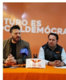
PRD LE COQUETE A LAVIADA Y A CALDERÓN.

Cirerol comience a escuchar las voces del partido del Sol Azteca que ya le habrían dicho que en ese partido nunca sería objeto de reprimendas o enojos. Hoy estará en Zacatecas el presidente del Consejo nacional del PRD, Ángel Ávila, quien tiene la encomienda de comenzar a dialogar con el diputado y el empresario Cuauhtémoc Calderón, quienes