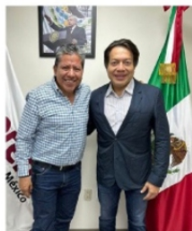
DAVID MONREAL Y MARIO DELGADO se reúnen en CDMX

El gobernador David Monreal aprovechó su reciente viaje a la Ciudad de México para varias cosas, una de ellas para reunirse con el dirigente nacional de MORENA Mario Delgado Carrillo, con quien, según dijo, siempre ha compartido la visión de transformación de México y Zacatecas. Casualmente estuvo por esas tierras, también la delegada del Bienestar en la entidad, quien no quita el dedo del renglón de buscar su postulación al Senado de la República. En la conversación entre el mandatario y el dirigente partidista, el tema obligado fue el recientemente desaforado y destituido del ex alcalde de Guadalupe, quien se perfilaba a buscar la candidatura a la diputación por el cuarto distrito electoral federal, y que ahora, no podrá representar a los zacatecanos como diputado, sino que con su desafuero dejó en la orfandad a muchos.