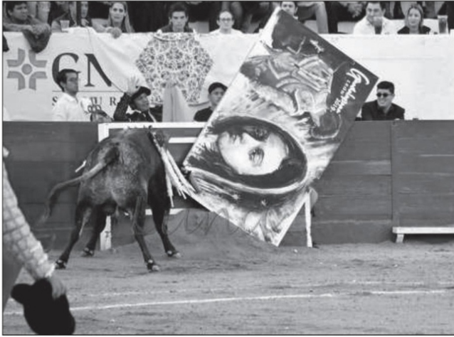
Impio, toro bravo que remató con furia en un burladero, desprendiendo la tela de Antonio Ruiz que lo decoraba ■ FOTO: JUAN ANTONIO RUÍZ