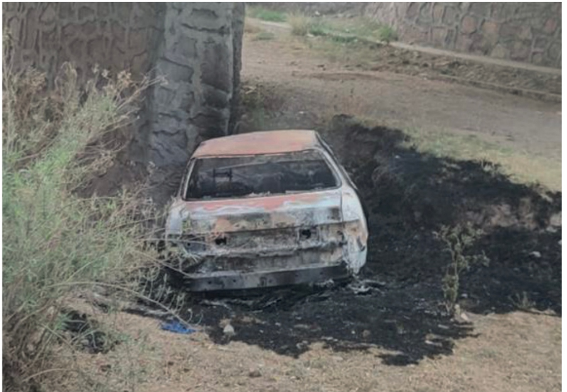
El vehículo calcinado con dos personas adentro