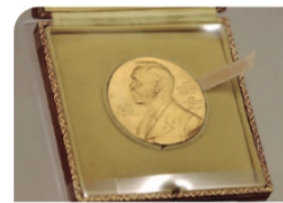
LA MEDALLA del Nobel de Literatura, una de las piezas exhibidas.

EN LA SEDE para preservar el acervo y patrimonio del poeta y de su esposa exhiben obras de arte, su biblioteca, el traje que usó el poeta cuando recibió el Nobel...; estabilizan para catalogar 651 piezas de joyería. pág. 18