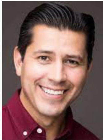
Julio César Chávez Padilla