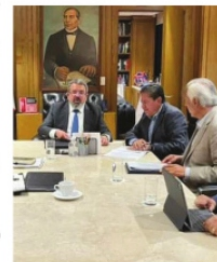
JORGE NUÑO Y DM, se reunieron para tema carreteras.

El secretario de Infraestructura, Comunicaciones y Transportes, Jorge Nuño , firmó ayer con el gobernador de Zacatecas el acuerdo por el que se van a ministrar a la entidad, los 800 millones de pesos que el Presidente de la República comprometió en su última visita. Se informó que está avanzando en el objetivo de reconstruir y modernizar la red carretera estatal. Sólo falta saber el calendario de suministro de los recursos y cuáles serán las obras a ejecutar.