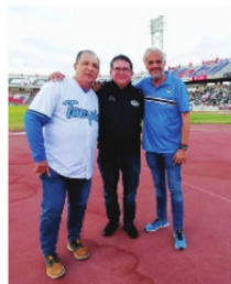
SE DESLINDA UAZ, de la violencia en el estadio.

Sin duda que la euforia que se vive en torno al posible ascenso de los Tuzos de la Universidad Autónoma de Zacatecas a la liga de Expansión, se puede convertir en una gran desilusión, no sólo para los jugadores y cuerpo técnico, sino para todos aquellos que ven en la Universidad Autónoma de Zacatecas, el futuro no sólo académico, sino también deportivo a cualquier nivel. La riña del sábado por la noche en el estadio Carlos Vega Villalba están muy lejos de que en Zacatecas se alcance una verdadera cultura de paz. Está en riesgo la continuidad no sólo de los Tuzos campeones, y pesa la posibilidad de una sanción de veto al Estadio, propiedad de los zacatecanos y que tiene en usufructo el equipo Mineros. Los hechos del sábado no son culpa de los universitarios y mucho menos de la Universidad. Hay responsabilidad compartida y ahora se tienen que asumir las consecuencias para todos los involucrados, comenzando por las autoridades que deben, siempre, dar garantías en eventos de esta naturaleza. Nos falta mucho por aprender y la primera división cada día se ve más lejos en Zacatecas.