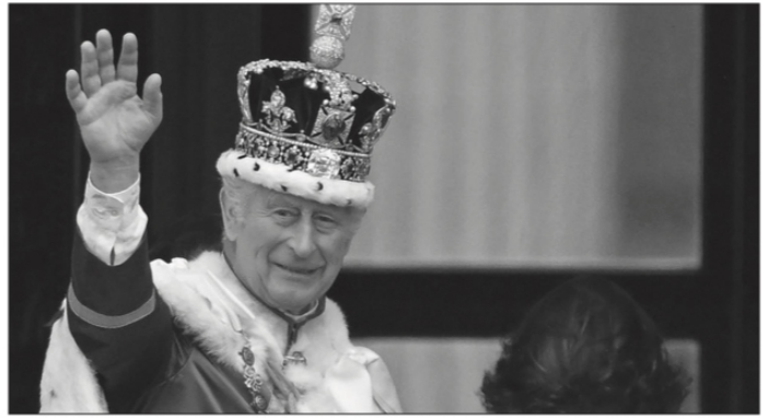
Coronación de Carlos III ■ FOTO: LA JORNADA ZACATECAS

Y dadas unas perturbadoras declaraciones oficiales recientes, cabe señalar tajantemente, que lo que legitima a la Suprema Corte es la defensa de la Constitución Política, fruto de una revolución justa, al margen del vaivén popular y de facciones. La Corte es garante de la vigencia de dicha Constitución, sin la cual no hay República, ni división de poderes, ni democracia, ni paz, ni unidad nacional. El derecho y la justicia no son cuestión de mayorías, sino de razón. ■