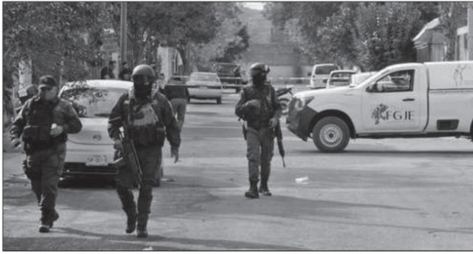
Además de las acciones de combate a la delincuencia, debemos de seguir trabajando para erradicar las causas que provocan la violencia