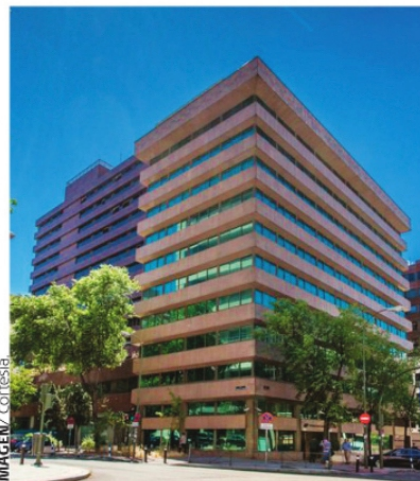
LA ORGANIZACIÓN MUNDIAL DEL TURISMO (OMT) ES UN ORGANISMO INTERNACIONAL QUE TIENE COMO PROPÓSITO PROMOVER EL TURISMO.

Al tocar el tema de los ingresos podemos ver también que se volvió a superar la barrera del billón de dólares en el 22, con un crecimiento del 50% en términos reales compara-