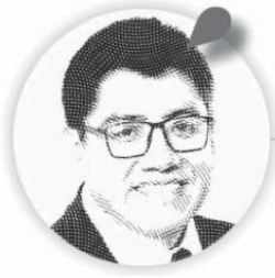
Saúl Monreal Ávila