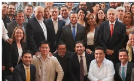
DAVID MONREAL, se reunió con el presidente, y otros.

La convocatoria para que el gobernador David Monreal junto con sus homólogos acudieran a Palacio Nacional tuvo como propósito central perfilar el calendario electoral de la 4T, también fueron llamados algunos de los "súper delegados" en el país, la meta es ir perfilando el proyecto de encuesta para que Claudia Sheinbaum sea la elegida de MORENA a la candidatura presidencial.