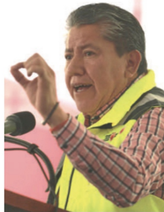
David Monreal Ávila