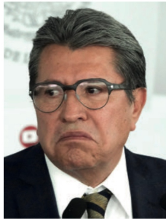
Ricardo Monreal Ávila