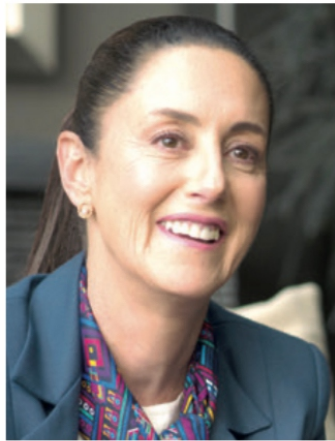
Claudia Sheinbaum Prado