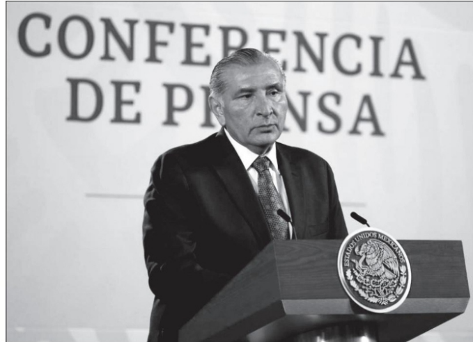
El secretario de Gobernación es parte del equipo más cercano al presidente y la persona, de todo el gabinete presidencial, más afín al proyecto y a los objetivos de López Obrador

por nuestro presidente, pues la derecha no ha parado de atacar desde los medios de comunicación, desde la propaganda golpista, desde un alud de mentiras que, a base de repetición, quieren convertir en realidad.