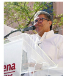
RICARDO MONREAL, viene esta semana a Zacatecas.

El próximo viernes en el Centro Platero de Zacatecas, el senador Ricardo Monreal estará encabezando, junto al gobernador, el Foro "Jóvenes legislando por la transformación", capítulo Zacatecas. Es el pretexto perfecto para analizar entre ambos, las acciones y modificaciones que deben hacer en el gabinete de cara al segundo informe. En lo que han sido dos semanas intensas