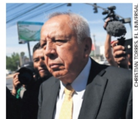
Francisco Garduño, titular del Instituto Nacional de Migración.