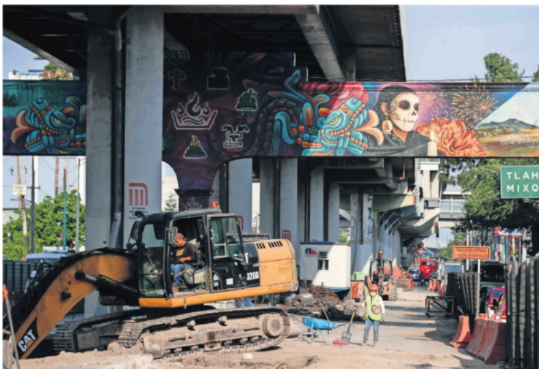
Pese al avance en las obras de reparación de la Línea 12 del Metro, aún no hay fecha de reapertura.