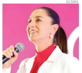
Claudia Sheinbaum en León.

Conferencia. De gira por León, Guanajuato, Claudia Sheinbaum ofreció una conferencia en la que destacó que "las mujeres sigamos luchando por la igualdad, porque no puede haber democracia sin las mujeres". La jefa de gobierno de la CDMX fue arropada por más de 7 mil guanajuatenses que desbordaron el foro sede de su conferencia, evento que fue convocado por el Instituto Tecnológico de León. PAG 8