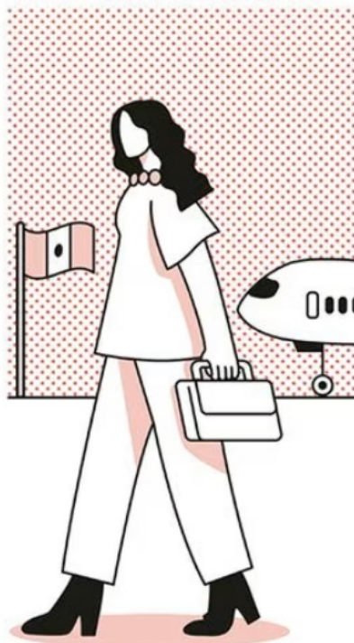
ILUSTRACIÓN: ANI CORTÉS, EL UNIVERSAL