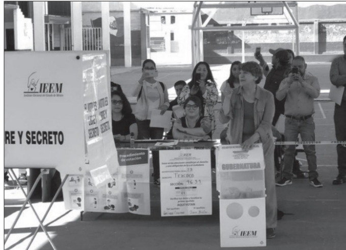
Queda claro que, con el gobierno de Delfina Gómez, y los resultados de la 4T en el país y en el estado, aún tiene el enorme reto de convencer a 3 cuartas partes de los mexiquenses

uso de todas las herramientas que tengan a modo, para minimizar, ocultar o banalizar el gran cambio que está viviendo nuestro país.