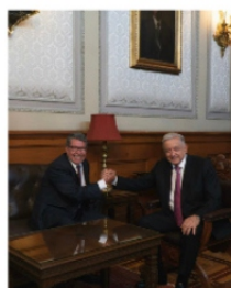
RICARDO MONREAL, SENADOR.

En Zacatecas ya comenzaron a moverse los que dicen tener la cercanía con el Senador Monreal y la rebantiga por la coordinación de la campaña en la entidad ya comenzó entre varios actores. Seguramente saldrán muchas figuras a decir que son ellos los que representan al exgobernador.