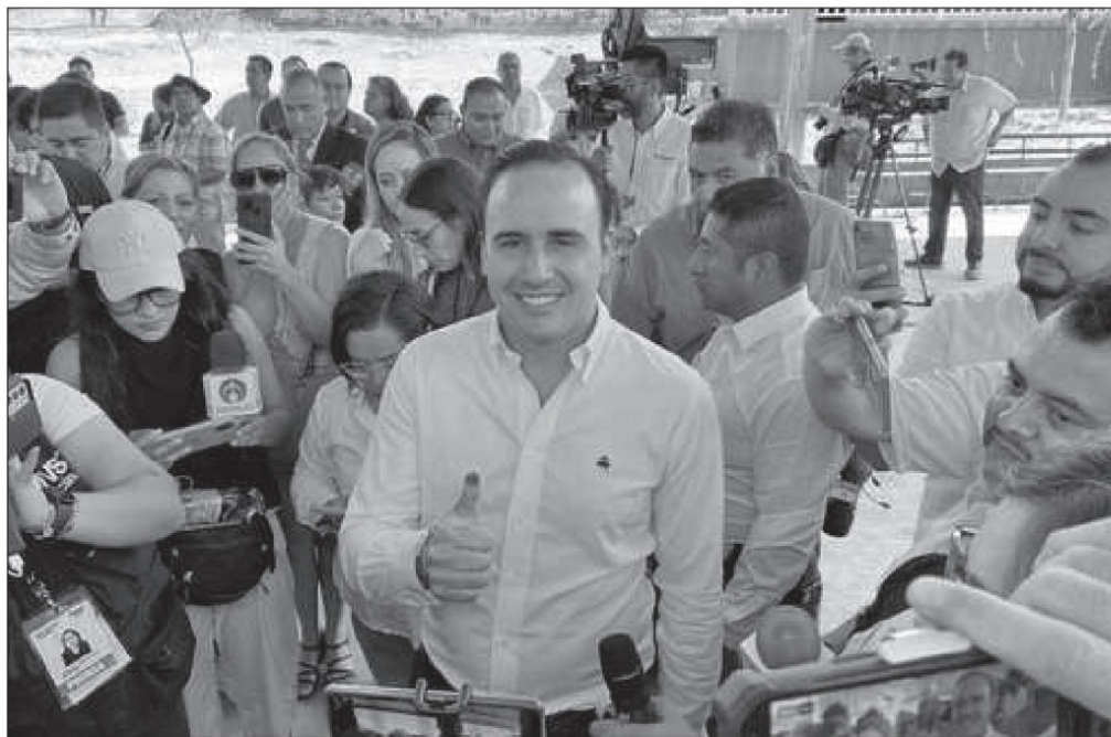
Manolo Jiménez, ganador de las elecciones para la gubernatura en Coahuila

Porque hemos escrito mucho al respecto, si se trata de encuestar quién es más conocido, pues manden de candidato a EL CHAPO GUZMÁN o A LUIS MIGUEL y puede que hasta nos vaya mejor, pero ojalá algún día decidan voltear los ojos en búsqueda de candidaturas provenientes de la SOCIEDAD CIVIL y no en los amigos compadres o parientes. ■