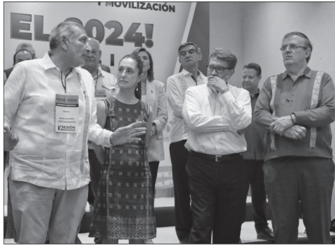
El Consejo de Morena se llevó a cabo el pasado domingo en la Ciudad de México