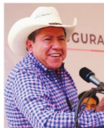
DAVID MONREAL, Gobernador de Zacatecas.

En síntesis, el "nearshoring" es un modelo industrial que aprovecha los bajos costos de producción y su cercanía con el mercado de consumo, pero que también depende de decisiones políticas, financieras y además de seguridad pública, porque de lo contrario, las empresas no vienen a Zacatecas. Es urgente que el gobernador revalore las condiciones y amplíe sus horizontes.