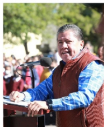
IMCO, señala que también en educación hay problemas.

Con esto, se fortalece la necesidad de que el Gobierno de David Monreal diseñe estrategias que detengan la caída en la calidad de la educación pública local. Es urgente plantear planes y programas que diseñan las políticas de calidad educativa, por lo que esta representa para el desarrollo de Zacatecas, de lo con-