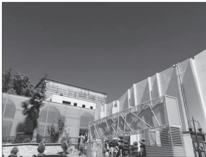
Instalaciones de la Unidad Académica de Derecho de la UAZ