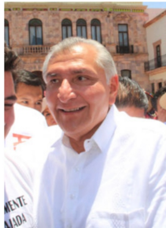
Adán Augusto López Hernández