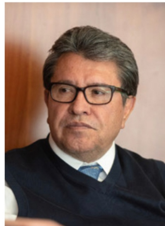
Ricardo Monreal Ávila un auténtico tirano-.