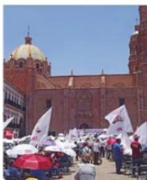
PLAZA DE ARMAS

llena de paraguas, sin la gente esperada y en una operación al estilo del Frente Popular de Lucha de Zacatecas, mostró la capacidad de movilización de quien organizó el evento, que ahora parece que le deja el camino libre al presidente de Fresnillo Saúl Monreal Ávila , quien sin sudar, se perfila como el mejor posicionado en las encuestas rumbo al Senado por MORENA. Adán Augusto López , que estuvo en Zacatecas encabezando un mitin que "no es mitin de campaña", sólo se limitó a decir que "a Zacatecas le va ir muy bien". Lo estuvieron flanqueando algunos actores políticos, que hoy buscan la simpatía del aspirante presidencial para estar en la mesa de negociación que defina las candidaturas en el 2024. Lo que sí quedó en evidencia, es que al organizador del evento sus canicas ya no le dan para más.