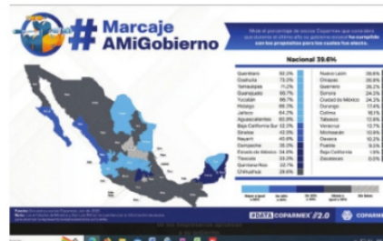
#DATA Coparmex, dio a conocer indicadores.

Hay requisitos excesivos, falta de claridad en