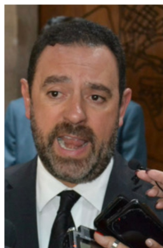
Alejandro Tello Cristerna