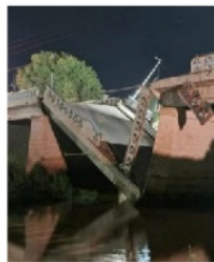
PUENTE HIDALGO, RÍO GRANDE ZACATECAS

Más de 200 mil afectados que no pueden transitar, un comercio afectado por el colapso y nueve municipios que no pueden conectar a la cabecera municipal, abre la discusión en torno a los trabajos, que al menos en el gobierno municipal anterior, debieron realizarse para el desazolve del puente y lo que ello tiene. Tampoco se puede solapar la falta de acciones de los distintos gobiernos estatales, incluido el actual que tiene dos años en el mandato, para evitar la tragedia, que por fortuna no cobró víctimas humanas.