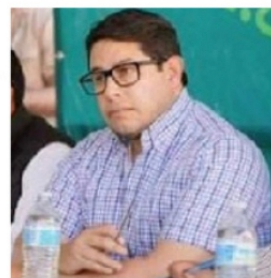
JORGE MIRANDA CASTRO, ALCALDE DE LA CAPITAL

Por esa razón busca cerrar con éxito este programa de sustitución de la red de drenaje de agua que tiene el municipio, para evitar que sigan los altos niveles de desperdicio, que en colonias como la Lázaro Cárdenas , llega hasta a 65 por ciento, por esa razón el vital se convierte en el más caro de todos los servicios. En lo que resta de la administración, busca invertir cantidades