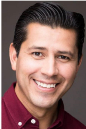
Julio César Chávez Padilla