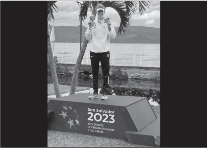
La mexicana Maité Arrillaga, quien conquistó el oro en par de remos cortos