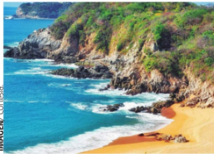
BAHÍAS DE HUATULCO, PARADISIACO LUGAR UBICADO EN LA COSTA OAXAQUEÑA.

Sin dudarle la realidad que vive el turismo nacional