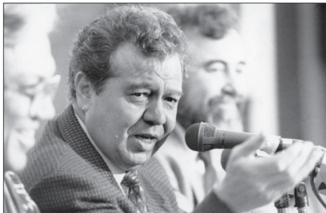
Porfirio Muñoz Ledo durante una conferencia de prensa del PRD, el 13 de noviembre de 1995

abajo, un nuevo partido con capacidades para impedir fraudes como el que acababa de sufrir. El 5 de mayo de 1989 nació el PRD, como último eslabón de la cadena de alianzas y fusiones iniciada 10 años antes por la visión histórica de Arnoldo Martínez Verdugo. Su programa fue redactado, en lo esencial, por Muñoz Ledo.