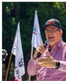
MARCELO EBRARD, no ha visitado Zacatecas.

Por lo tanto se ve muy lejana la posibilidad de que el ex canciller visite Zacatecas porque no hay nadie, al menos así se observa, que tenga la capacidad de organizar estructuras de apoyo y mucho menos organizar una "Reunión Informativa". Parece que tendrá más efectos positivos Gerardo Fernández Noroña , quien depende de las estructuras del Partido del Trabajo, pero al menos en Zacatecas, tendrá que ir sólo, sin el apoyo del gobernador.