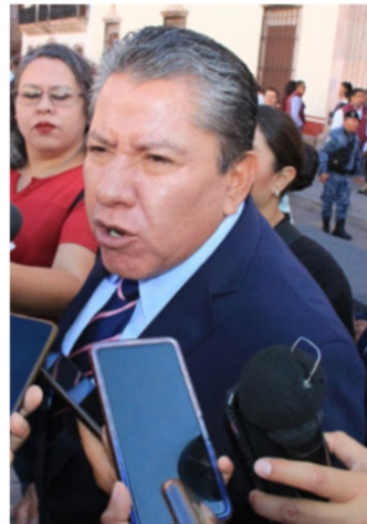
David Monreal Ávila