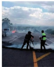
BLOQUEO DE CARRETERA, en Tepetongo

Un enfrentamiento entre grupos delictivos en Tepetongo provocó un operativo