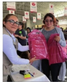
ENTREGA DE ÚTILES, por servidores de la nación

Este domingo comenzó la entrega de kits de útiles escolares en municipios como Apozol, Fresnillo, Ojocaliente, Pinos y Jalpa entre otros, y estuvo a cargo de los servidores de la nación, quienes entregan a nombre