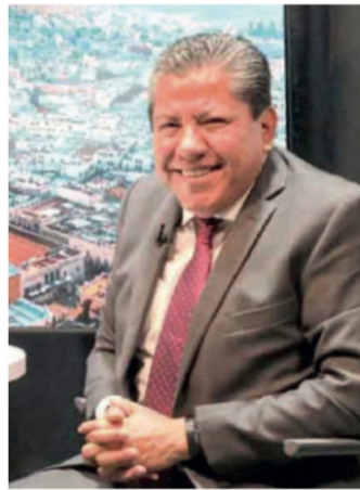
David Monreal Ávila