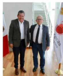
ANALIZAN PROYECTO Del segundo piso.

ninguna afectación al patrimonio, y se debe conocer el proyecto integral del transporte colectivo que sustituirá a las rutas de transporte, y que a la fecha sigue con un retraso de 23 meses, lo que refiere que ya se trabaja contra reloj y bajo presión.