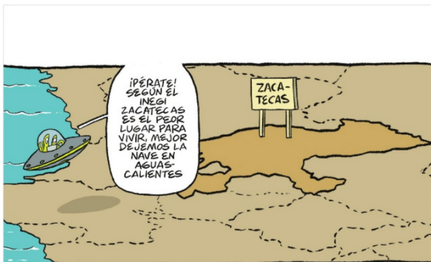
WUISHO EN Imagen