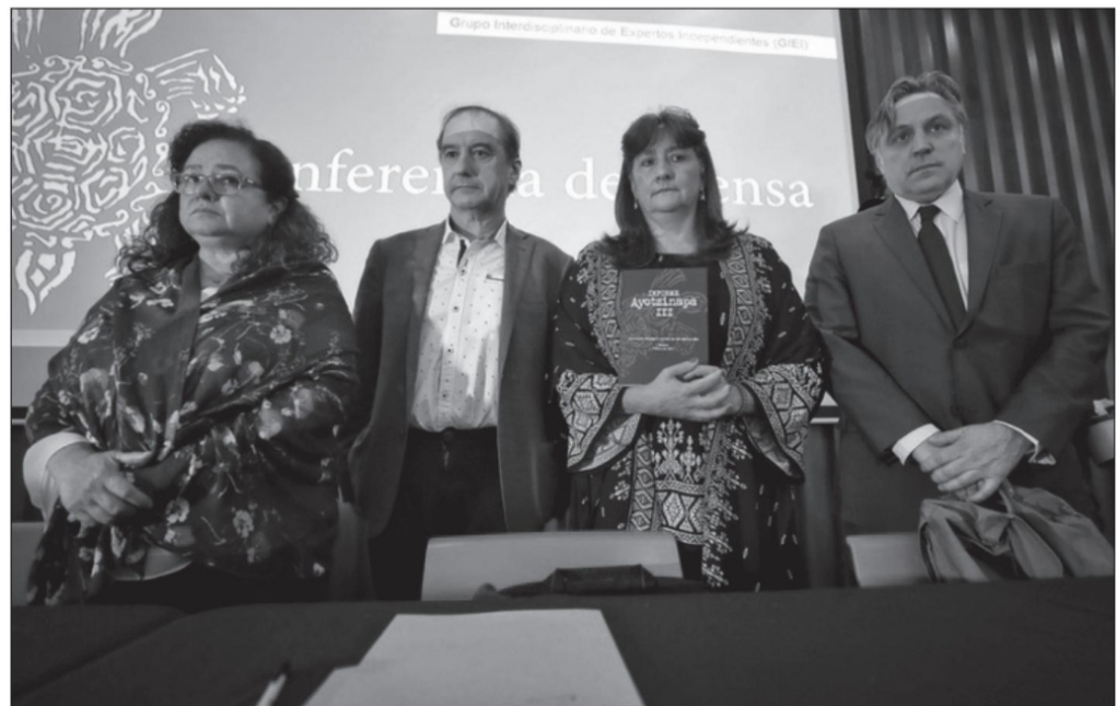
Este mes vence el mandato del Grupo Interdisciplinario de Expertos Independientes (GIEI)

AMLO MIENTE Y ESTÁ SUPEDITADO A LO QUE LAS CÚPULAS DE SEDENA LE INDIQUEN, AÚN CON SU SILENCIO. ■