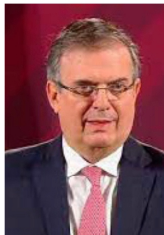
Marcelo Ebrard Casaubón