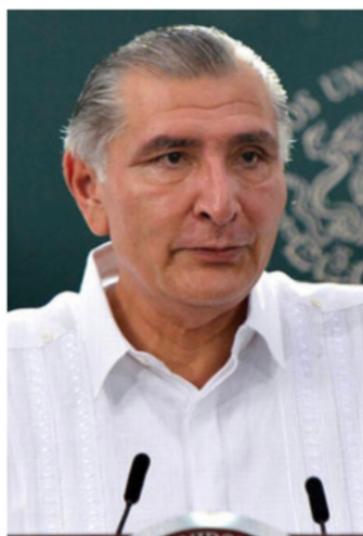
Adán Augusto López Hernández