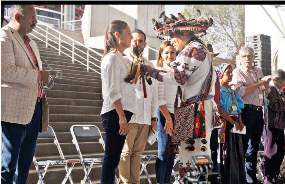
Claudia Sheinbaum, aspirante a la candidatura de presidencial de la república por el partido a la Morena