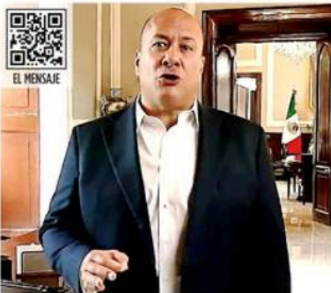
El Gobernador de Jalisco pidió a MC dar el primer paso hacia la construcción de un frente opositor.

En medio de jaloneos por la definición de candidaturas