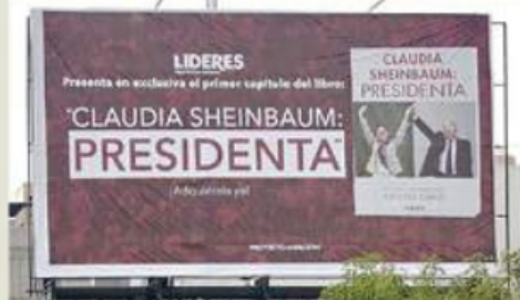
Los espectaculares que promocionan el libro sobre Sheinbaum "tapizan" avenidas de la CDMX.

La editorial Penguin Random House aseguró que no