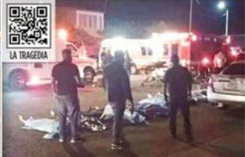
El incendio en el bar Beer House de San Luis Río Colorado ocurrió la madrugada de ayer.