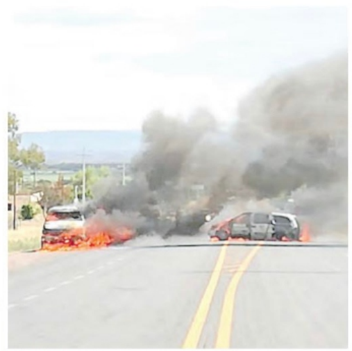
CERRARON el paso en la carretera federal 54.

cinco personas; tres de ellas estaban heridas y fueron trasladadas a un hospital. Luego de la detención del presunto grupo delictivo, sujetos armados despojaron con violencia a dos personas de sus vehículos, los cuales fueron atravesados e incendiados en la carretera federal 54, a la altura de la comunidad La Quemada, de Villanueva. La SSP destacó que "de inmediato se activó el protocolo antibloqueo" y, horas más tarde, anunció que la situación estaba "controlada", pues se había liberado la carretera.