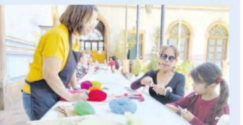
DISTINTOS TALLERES se impartieron en los recintos.