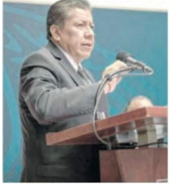
EL GOBERNADOR se basará en los resultados de las dependencias.