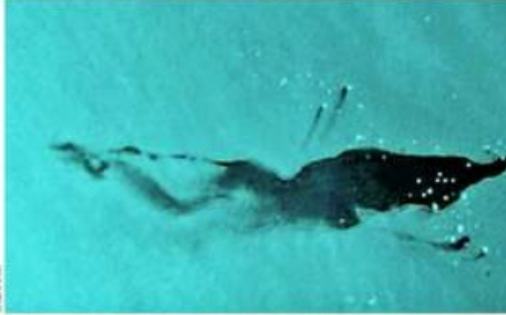
La zona del derrame se ubica cerca de la plataforma Nohoch-A, donde el 7 de julio ocurrió una explosión.

Imagen satelital del área afectada en los campos Ek Balam, en la Sonda de Campeche: