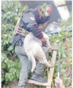
SE DETUVIERON a dos personas por violencia contra animales.