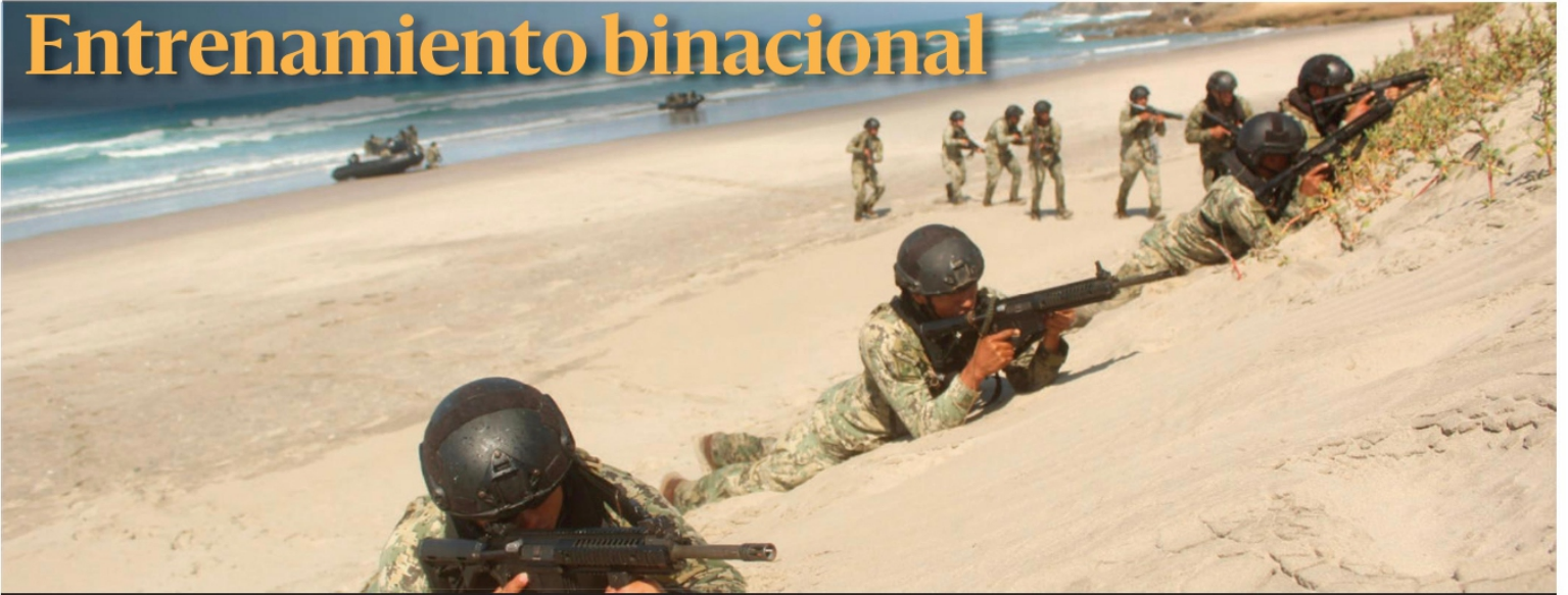
En Baja California se llevó a cabo un ejercicio militar binacional con un objetivo ficticio, una base para la elaboración de bombas de dispersión radiológicas. Participaron 461 elementos navales, entre marinos de México y del Comando Norte de EU y comprendido en el Plan de Cooperación Northcom-Semar. PAG 7