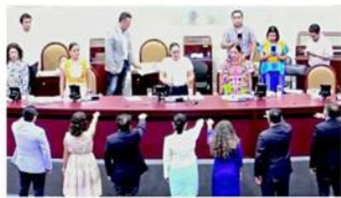
Integrantes de la mesa directiva del Congreso de Oaxaca que tomaron ayer protesta a los nuevos magistrados.

DOMINGO 23 / JULIO / 2023 CIUDAD DE MÉXICO 52 PÁGINAS, AÑO XXX NÚMERO 10,792 $30.00 REFORMA CORAZÓN DE MÉXICO