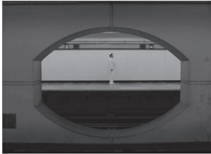
Fotograma del documental de la realizadora María José Cuevas

inevitables pifias y arbitrariedades de la justicia. Según afirma Sales, a quien el caso parece producirle gracia, en México se detiene primero y se investiga luego.