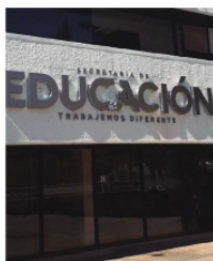
CAMBIOS PRÓXIMOS, En la Secretaría de Educación.