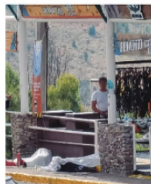
ASESINAN A "TURISTAS" EN LA BUFA

Cuando parecía que terminaba una semana de Folclor sin contratiempos, vino un homicidio en un escenario turístico del Cerro de la Bufa, donde una familia de migrantes fue agredida a balazos justo cuando esperaban turno para disfrutar de la Tirolesa. A pesar de que en los últimos meses se han notado cambios favorables en materia de seguridad, también es cierto que un solo hecho potencia ex-