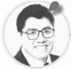
Saúl Monreal Ávila