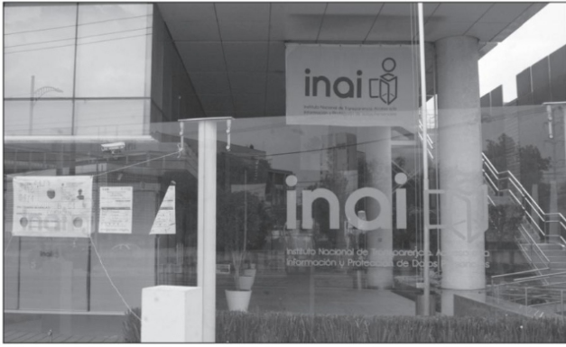
Oficinas del Instituto Nacional de Transparencia, Acceso a la Información y Protección de Datos Personales en Ciudad de México