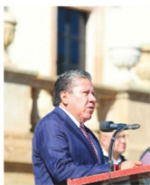
DAVID MONREAL, Gobernador de Zacatecas

Trabajadores de la Fiscalía General de Justicia acudieron a la embajada de Corea en México a entregar una carta informativa, para notificarle al país asiático la realidad que vive Zacatecas con el ánimo de que, ahora que llegará el mandatario a esa tierra, no los intente sorprender de que la situación es tranquila en materia de seguridad para las inversiones. Habrá que ver qué tanto los escuchan, porque la nota de un perro con una cabeza humana en el hocico llegó a esa tierra.