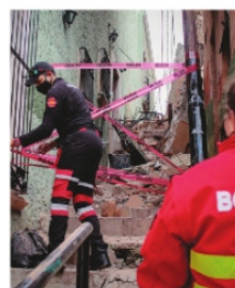
160 CONSTRUCCIONES en peligro de derrumbe.

En el polígono del Centro Histórico que corresponde a patrimonio cultural existen al menos 160 fincas en riesgo, lo que provoca que las lluvias por venir, si llegan, pongan en riesgo el Centro de la capital, justo en