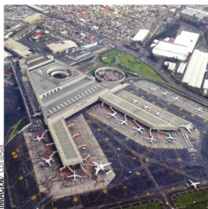
ENTIENDO LOS FENÓMENOS NATURALES COMO INCONTROLABLES, PERO SI USTED ES USUARIO DEL AICM, PODRÁ DARSE CUENTA DEL DETERIORO QUE HA TENIDO ÉSTE EN LOS ÚLTIMOS AÑOS

Este nuevo aeropuerto se encuentra en el barrio de ArnavutKoy al noroeste de Estambul cercano al mar negro. Este complejo aeroportuario se encuentra a 45 kms. De los principales distritos del centro de la ciudad. El objetivo principal de los Turcos es construir un aeropuerto grande en Estambul para cubrir y gestionar el tráfico aéreo así como los viajes que van en una etapa