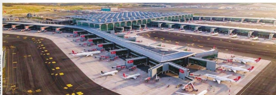
NUEVO AEROPUERTO DE TURQUÍA SE ENCUENTRA AL NOROESTE DE ESTAMBUL A 45 KMS DE LOS PRINCIPALES DISTRITOS DEL CENTRO DE LA CIUDAD.

El aeropuerto ya cuenta con tiendas libres de impuestos, cafeterías, restaurantes, casas de cambio, bancos, renta de autos, lugar para atención a clientes, atención a hospedaje y oficina de reservas de hotel en las áreas de llegada, claro está que para ingresar al aeropuerto y a salas de embarque deberá pasar por seguridad previamente. Para llegar al aeropuerto puede tomar rutas de autobuses públicos que como norma no regresan a lugares turísticos. Si usted llega como tal, le recomiendan tomar transporte privado. Si lleva mucho equipaje o niños las autoridades del aeropuerto le hacen la misma recomendación. Como verá, cuando se hacen las cosas bien no hay nada que decir. Es una lástima que nuestro gobierno haya dejado ir la oportunidad que teníamos para alcanzar al tren del futuro, mismo que cuando pasa se torna cada minuto como crucial y demasiado complicado para alcanzarlo nuevamente. Espero con ansia que hayamos aprendido de nuestros errores, hasta la próxima.