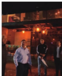
OSWALDO PINEDO , secretario de salud.

Ahora que se le vio muy bailador al secretario de Salud en la Feria Nacional de Fresnillo, los integrantes del Sindicato Nacional de Trabajadores de Salud exigen a Oswaldo Pinedo tenga la misma actitud para resolver los problemas que afectan la calidad de servicio que se le da a los zacatecanos. Los médicos y enfermeras llegaron al límite y decidieron bloquear la dirección general de los servicios de salud y la oficina del secretario, hasta que Oswaldo Pinedo resuelva de fondo los