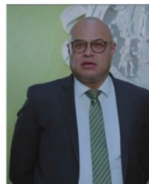
FRANCISCO MURILLO, Fiscal General de Justicia.

están hechos manifestantes, porque la respuesta ante tal anuncio fue señalar que las puertas para los administrativos si estaban abiertas y acusan de iniciar procedimientos legales. El tema es que ahora que ya se vieron afectados la mayoría de los trabajadores que se mantienen trabajando, la protesta se vuelve en contra de los manifestantes; hay un clima de unidad entre el resto de los trabajadores, que aunque pueden simpatizar con el movimiento y aceptar los incrementos, no están de acuerdo que la protesta les afecte en el bolsillo. Es tiempo de que se flexibilicen y acudan al llamado, porque la protesta se les puede revertir.