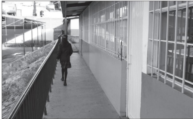
Hasta ahora el punto crítico se ha depositado en la educación.