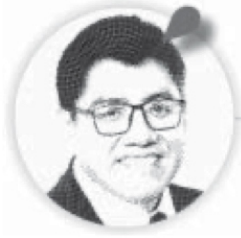
Saúl Monreal Ávila