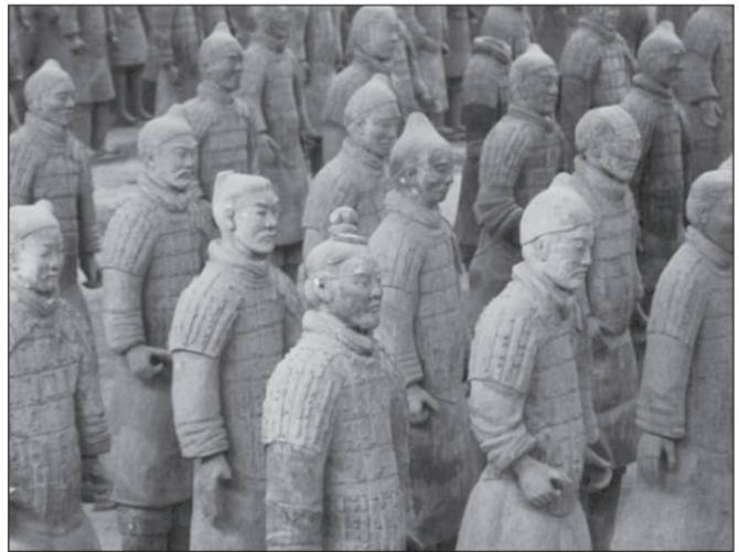
Mausoleo de Qin Shi Huang.

Lo lamentable es que en todo esto el pueblo nada tiene que ver y ello significa, por desgracia, que hay un vacío de autoridad que tiene que ser llenado por el poder como una situación de hecho. Seguramente todo esto tiene que cambiar. El destino manifiesto del sistema del gran elector de su propio sucesor debe desaparecer, si no se transforma radicalmente. ¿Hasta dónde y con qué características? Eso dependerá de la actividad de los grupos, y partidos realmente representativos en México. ■