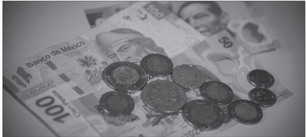
La economía mexicana continúa generando valor y evitando el cuadro de una desaceleración profunda

1 INEGI, datos disponibles en: https://www.inegi.org.mx/app/saladeprensa/noticia.html?id=8314