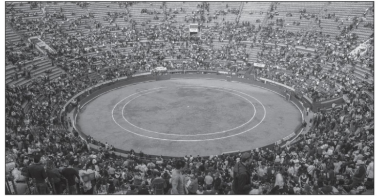
Plaza de Toros, Ciudad de México.

Álvaro García Hernández alvarogarciahernandez2027@gmail.com