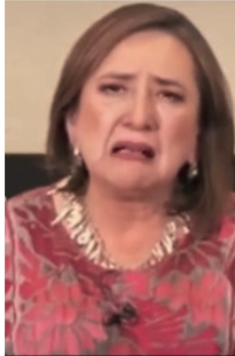
Xóchitl Gálvez Ruiz