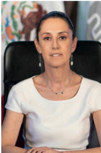
Claudia Sheinbaum Pardo