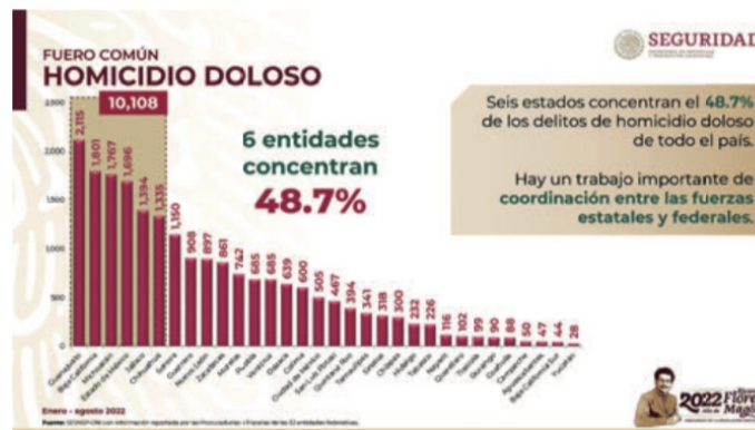
De enero a agosto: 861 asesinatos, 107.6 ejecuciones por mes (Gráfico del Gobierno de México)

una mujer dentro de un negocio ubicado en la calle 5 de Mayo en el centro de esa ciudad tan peligrosa, que ya compite con Fresnillo; el letal ataque armado sucedió a pleno sol, a eso de las 3:30 de la tarde y trascendió que la asesinaron por negarse a pagar el derecho de piso a un cártel del narcotráfico: Obvio, no hay detenidos.