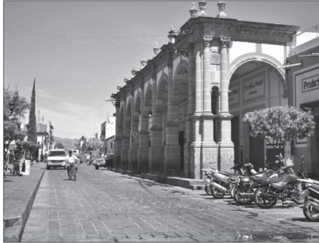
Jerez, lugar de la escuela pía de don Isidro Abundio de la Torre