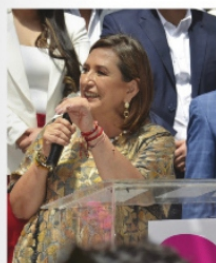
XÓCHITL GÁLVEZ encontró un FAM dividido.

Sólida y con el compromiso de poner orden en el Frente Amplio por México y la eventual disputa que existe entre los partidos políticos que la integran para ver quien tiene más cercanía, llegó a Zacatecas la aspirante presidencial Xóchitl Gálvez Ruiz , que en esta gira de