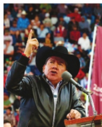
DAVID MONREAL urgió rescatar al campo.

solución ante la sequía, de lo contrario, esperan que las palabras de Jesús Padilla Estrada, no se conviertan en una profecía, donde se vea el mayor deterioro del campo en todo el siglo XXI.