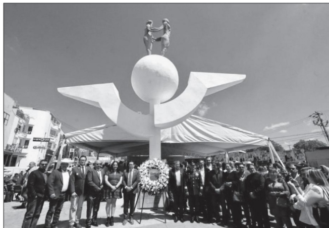
Ofrenda floral con motivo del Día de la Zacatecana y el Zacatecano Migrante