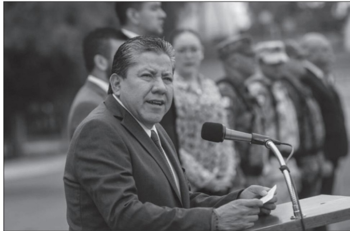
David Monreal Ávila, gobernador de Zacatecas

El titular del Ejecutivo ha señalado que su gobierno es un bastión contra la deshonestidad y la corrupción, es imprescindible señalar que las sanciones para quienes transgreden la ley y nuestra férrea política de austeridad son pruebas irrefutables de nuestro compromiso