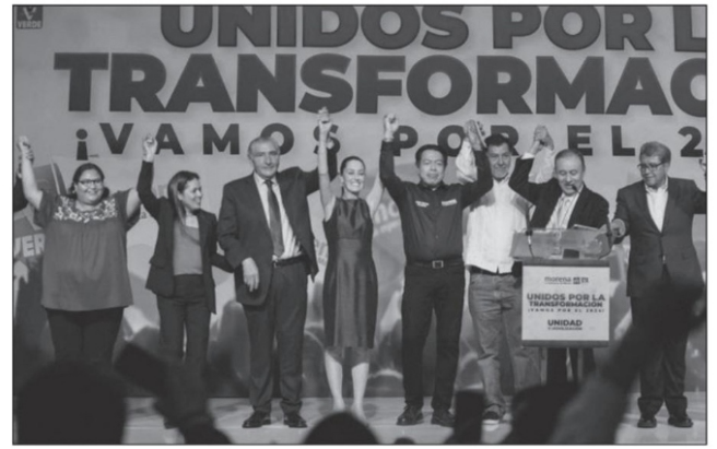
Claudia Sheinbaum es nombrada coordinadora nacional de la Defensa de la 4T.

Lo que advierte el Instituto Mexicano de Ejecutivos de Finanzas (IMEF) así como Citibanamex de que hay riesgo de baja de calificación crediticia por el déficit fiscal, ello no acontecerá, debido a que el déficit fiscal será sobre todo para cubrir el pago de la deuda y las calificadoras responden a los intereses de los acreedores. La baja calificación será por la falta de crecimiento económico, como por las presiones sobre el sector externo y los problemas de insolvencia que se están presentando como consecuencia de las políticas predominantes de alta tasa de interés, peso fuerte y austeridad fiscal que las propias calificadoras recomiendan. ■