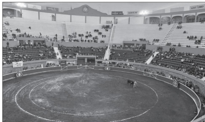
Plaza de Toros Monumental de Zacatecas.

ficación de "sobresaliente cum laude " por la defensa de su tesis doctoral Lesiones anatómicas producidas en el toro por los trebejos empleados en la lidia, autor asimismo de libros sobre cirugía experimental,