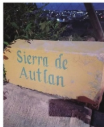
TERRENO DONADO EN 2016 permanece como lote baldío.

El terreno donado en aquel momento, tiene años abandonado y actualmente se mantiene como un lote baldío que no ha sido construido en la