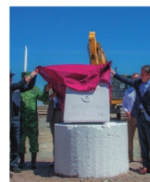
SIN CERTEZA JURÍDICA el terreno donde construyen

Es claro los primeros 250 millones invertidos en la edificación, provenientes del Fondo de Apoyo a la Seguridad Pública (FASP), no pueden ser usados en el concepto de construcción, por lo que hoy además de que se construye en un lugar que es propiedad privada y que la Legislatura no ha enajenado el inmueble en favor del Gobierno del Estado, se corre el riesgo de una observación de la Auditoría Superior de la Federación, lo que pone en riesgo el mayor proyecto en materia de seguridad pública. Alguien no le ha dicho la verdad al gobernador y ahora, no sólo están construyendo en propiedad privada, sino que además lo hacen con recursos que deben ser usados para equipamiento en tecnología, armamento, patrullas, pero no para la construcción. Pueden existir varias ilegalidades que se pueden pagar mucho más caras