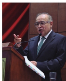
ARTURO NAHLE Pidió no encumbrar políticos

Con mucha energía, el Magistrado Presidente del Tribunal Superior de Justicia, Arturo Nahle García se metió al terreno político y con sus expresiones, sin duda que causó malestar entre la clase política que hoy busca un espacio para alcanzar una candidatura en el siguiente proceso electoral. También generó incomodidad en el titular del poder ejecutivo, David Monreal Ávila , quien no pudo disimular el fastidio por lo que decía en la Tribuna de la Legislatura el presidente del Poder Judicial. Pero más incomodidad causó porque justo cuando rendía su informe, también estaban localizando los cuerpos de los siete jóvenes privados de la libertad el domingo pasado en Villanueva. Ante una clase política reunida en el segundo piso de la Legislatura estatal, convocó a la población a entregar la representación del estado a los mejores hombres y mujeres, a los más capaces, los más honrados