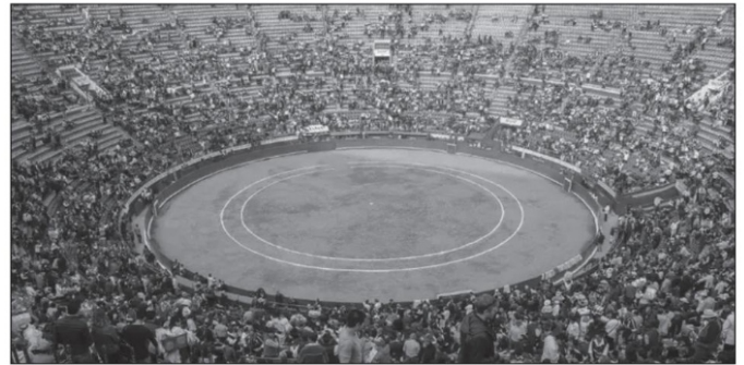
Plaza de Toros México, en Ciudad de México.