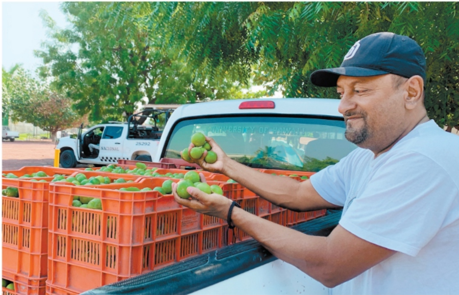
El corte de limón se reactivó ayer en Apatzingán y esperan que el sector se recupere pronto, luego de cuatro semanas sin actividad.

Tras casi un mes de parálisis retoman el corte y distribución del cítrico; productores reconocen que siguen obligados a pagar las extorsiones