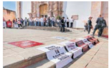
El gobernador del estado David Monreal Ávila rindió su segundo informe de actividades.

GOBERNADOR: VAMOS POR EL CAMINO CORRECTO