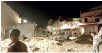
DAÑOS en Marrakech, ayer.

MOVIMIENTO de 6.8, el más severo en ese país, colapsa estructuras; registran 153 heridos; inicia rescate de personas atrapadas. pág. 13