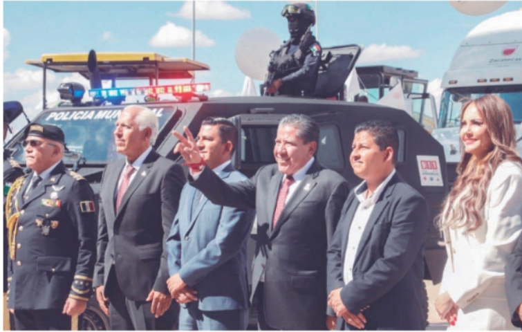
DAVID MONREAL entregó patrullas al concluir el informe.

Acompañado de su gabinete, resaltó que fueron 1 mil 400 millones de pesos invertidos en construcción de paz, con lo que aseguró que se logró disminuir la incidencia delictiva para pasar del segundo lugar al 24, además de insistir en que se redujo la cifra de homicidios dolosos. David Monreal reconoció la crisis por víctimas de desapariciones forzadas: “No vamos a negar la lamentable situación por la que atraviesan el país y