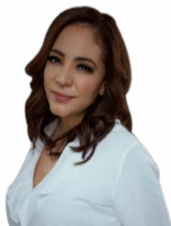
MARÍA DEL CARMEN SALINAS