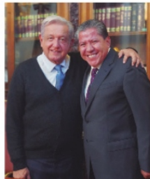
DAVID MONREAL Y LÓPEZ OBRADOR, se reúnen.

Sin duda que muy importante puede ser la reunión que sostuvieron el miércoles en Palacio Nacional, el Presidente Andrés Manuel López Obrador y el gobernador David Monreal Ávila , pues puede significar un cierre de año no tan complicado como han sido al menos los dos anteriores y que diciembre y sus posadas le signifiquen calma y mucha tranquilidad a la administración estatal.